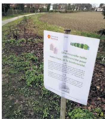
Mais où sont passées les haies? Tara Kerpelman Puig