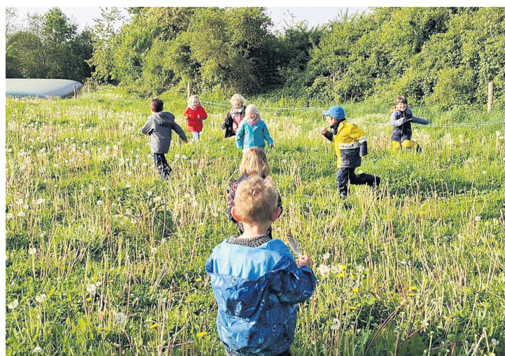
Les Loupiots du Chambet à Meinier.