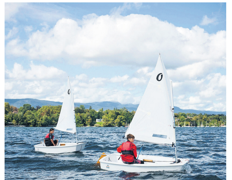
Moment de détente sur le lac Léman. CNBe

Accès parking Port Gitana, bus, vélo, CEVA arrêt Genthod-Bellevue. Infos sur www.cnbe.ch