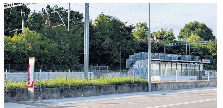
Malgré l'accès difficile de l'arrêt TPG 29 côté Jura au Creux-de-Genthod, un test a été mis en place. Tara Kerpelman Puig

Un passage pour piétons en trois tronçons, reliés par deux îlots, avec un éclairage, a été proposé par l'Office cantonal des transports (OCT) et est soutenu par le Conseil administratif.