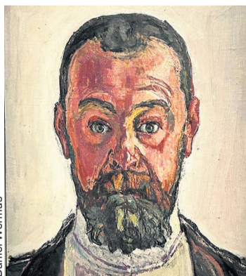
Autoportrait de Hodler.