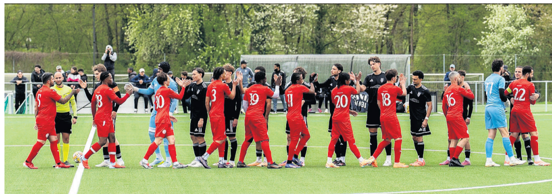
L'entrée des équipes sur le terrain. Raw Tiago