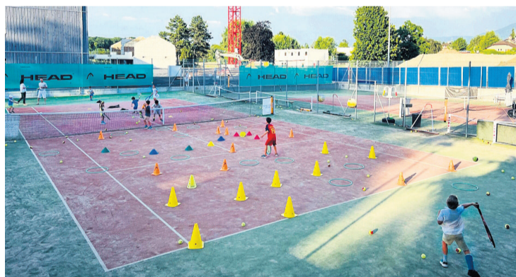
Activités ludiques sur le court numéro 2. Patrick Jean-Baptiste

Plus d'infos sur son site internet tccorsier.ch