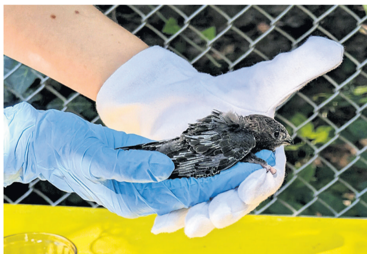
Un martinet dans les mains d'une bénévole au COR.

«Nous en avons réceptionné 3100 depuis le début de l'année. Aujourd'hui, 24 juin, nous avons une quarantaine de mar-