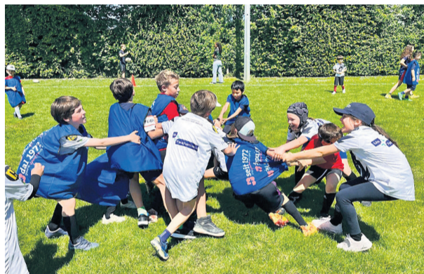
Une mêlée joyeuse et sans violence.