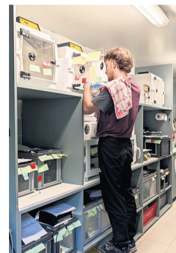
Bénévole avec les oisillons.

que les oisillons n'ont d'autre choix que de sauter. Mais au sol, ils ne seront pas nourris par les adultes.»